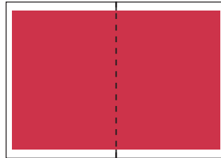
2/1 im Satzspiegel – über Bund laufend 388 mm breit x 252 mm hoch