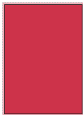
1/1 mit Anschnitt 210 mm breit x 297 mm hoch plus 3 mm Beschnitt