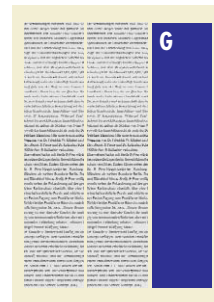
G 1-spaltig im Satzspiegel 57 mm breit x 270 mm hoch