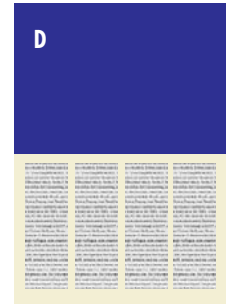
D 1/2 mit Anschnitt 216 mm breit x 150 mm hoch