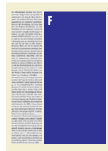
F 2-spaltig im Satzspiegel 119 mm breit x 270 mm hoch