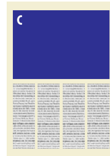
C 1/2 im Satzspiegel 181 mm breit x 130 mm hoch